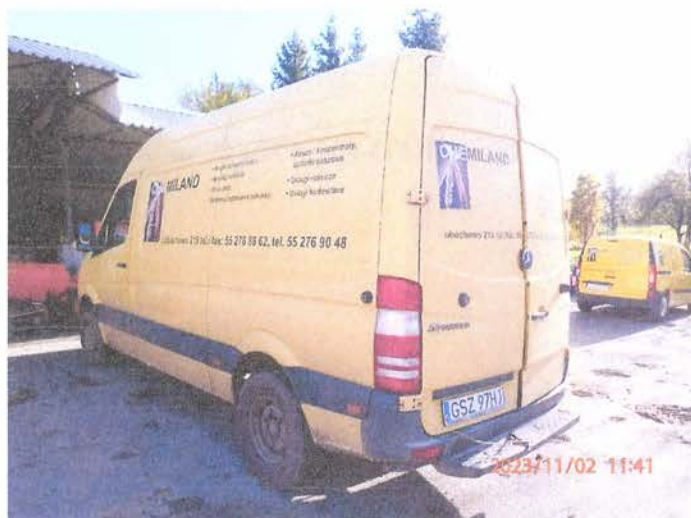
Fot. 3 PB020161