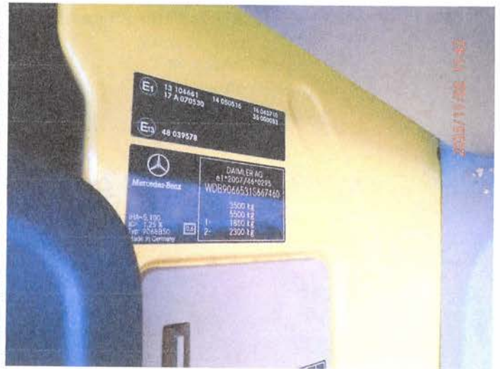
Fot. 6 PB020166