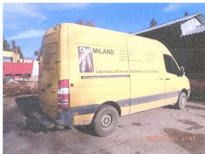
Fot. 4 PB020160

Biurowo Rzeczoznawstwa Samochodowego. Ruchu Drogowego, Wyceny Maszyn i Urządzeń inż. Mirosław Kołomański 83-200 Starogard Gdański NIK 592 1 22 27 93