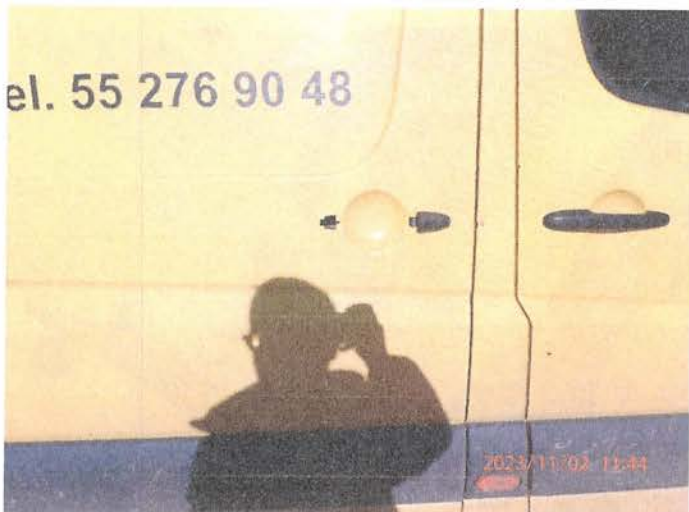
Fot. 9 PB020180