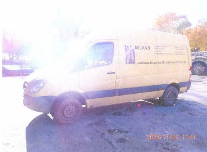
Fot. 1 PB020158