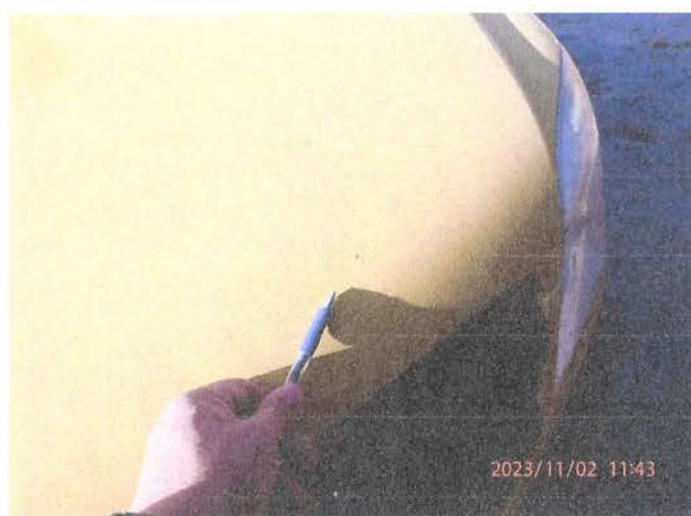
Fot. 13 PB020176