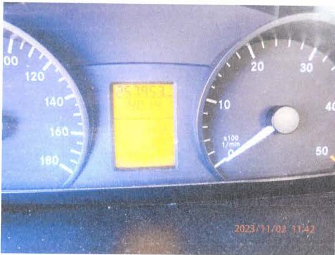
Fot. 5 PB020167