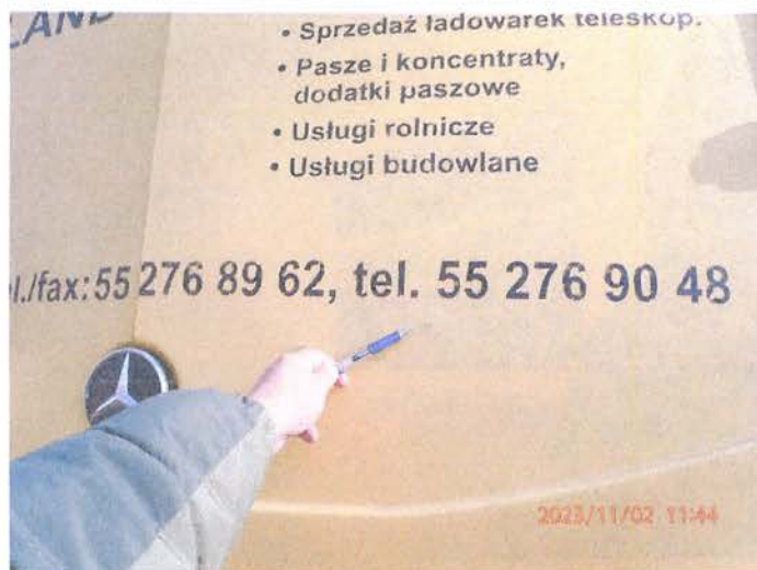
Fot. 11 PB020178