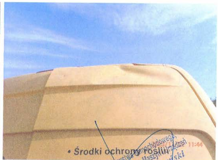
Fot. 10 PB020179