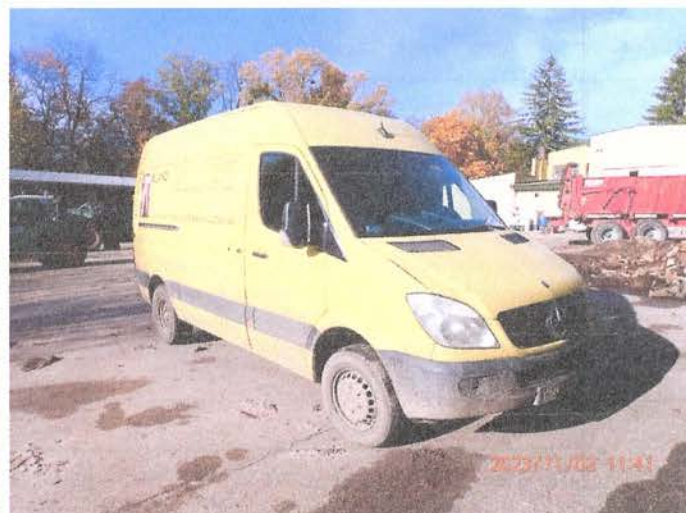
Fot. 2 PB020159