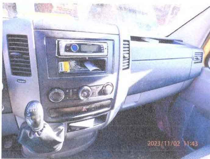
Fot. 19 PB020170

Biurow Rzeczoznawstwa Samochodowego, Ruchu Drogowego, Myceny Maszyn i Urządzeń inż. Mirosław Kołomański 63-200 Starogard Gdański NIP 8821339006