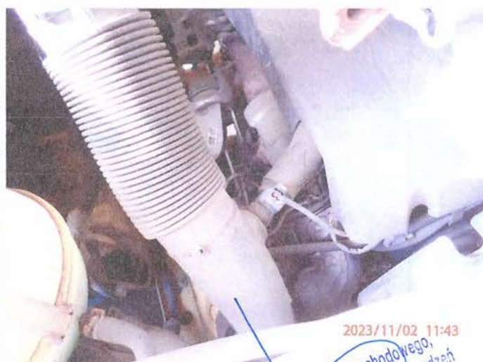
Fot. 16 PB020173