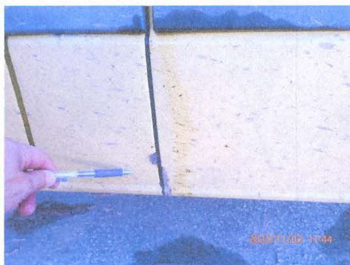
Fot. 12 PB020177