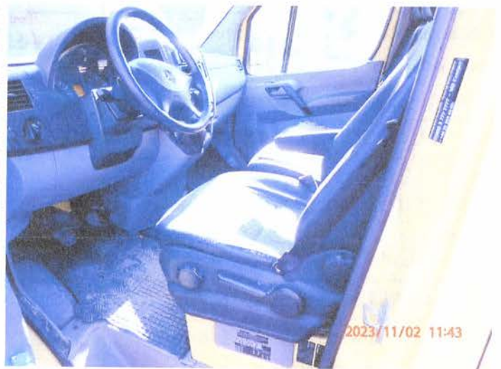
Fot. 18 PB020171