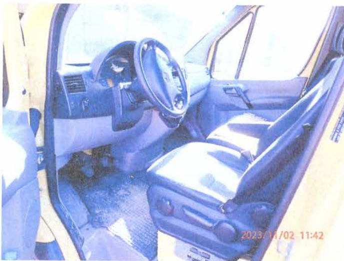
Fot. 7 PB020165