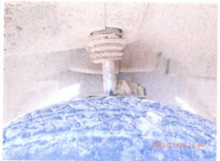
Fot. 8 PB020181