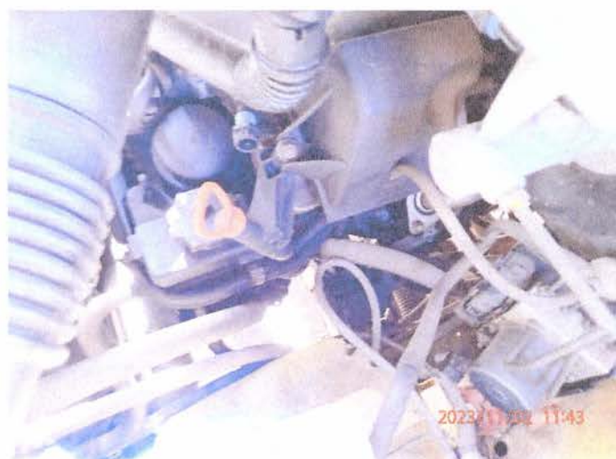
Fot. 15 PB020174