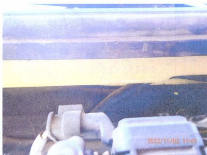
Fot. 14 PB020175