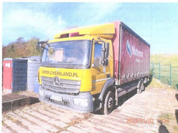
Fot. 2 PB020091