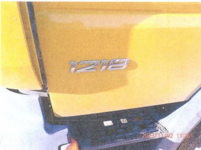
Fot. 13 PB020102