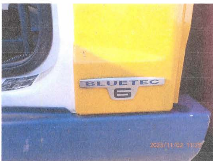
Fot. 8 PB020097