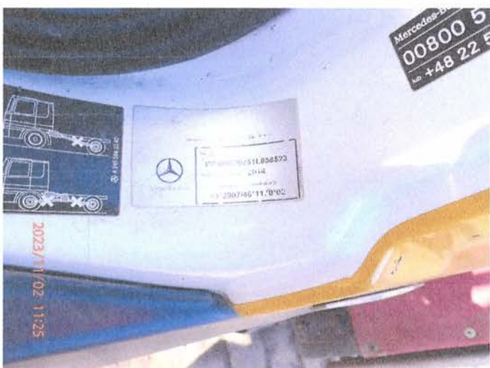
Fot. 9 PB020098