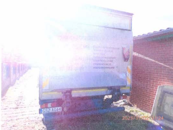
Fot. 4 PB020093

Biuro Przetwarzalstwa Samochodowego, Ruchu Drogowego, Wyceny Maszyn i Urządzeń inż. Mirosław Kolomański 83-200 Sterogard Gdański NIP 492133966