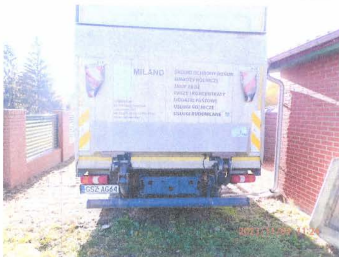
Fot. 5 PB020094