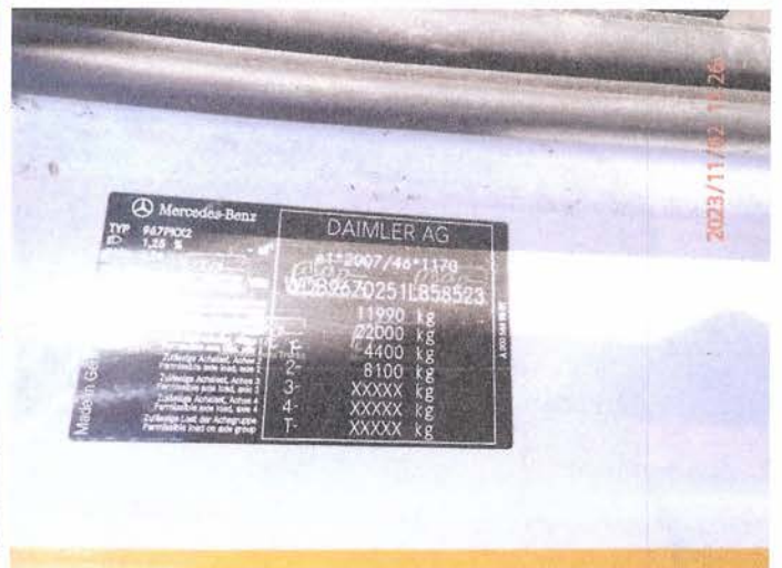
Fot. 14 PB020103