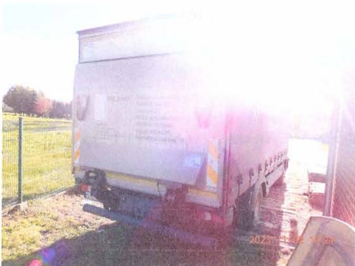
Fot. 3 PB020092