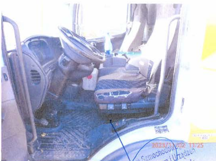
Fot. 10 PB020099

Biurowo Rzeczoznawstwa Samochodowego Ruchu Drogowego (Wyceny Maszyn i Urządzeń) inż. Mirosław Kołomański 83-200 Stargard Gdański NIP 622 433 886