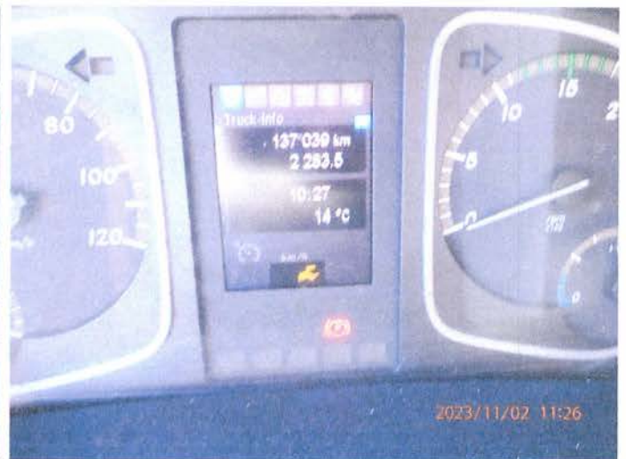
Fot. 12 PB020101