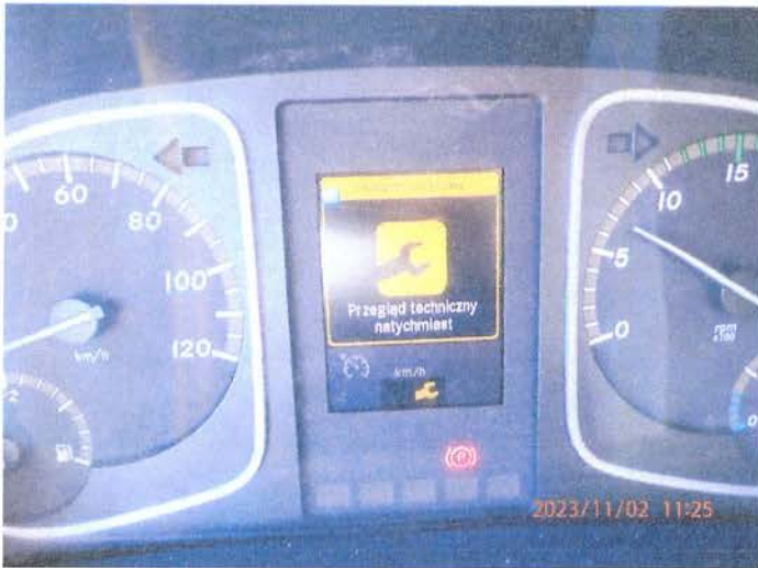
Fot. 11 PB020100