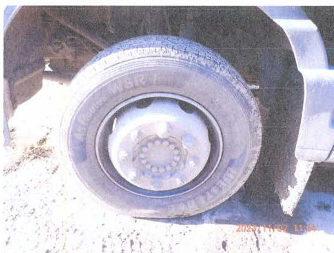
Fot. 6 PB020095