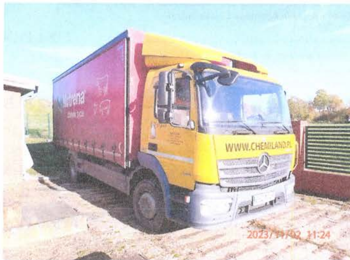
Fot. 1 PB020090