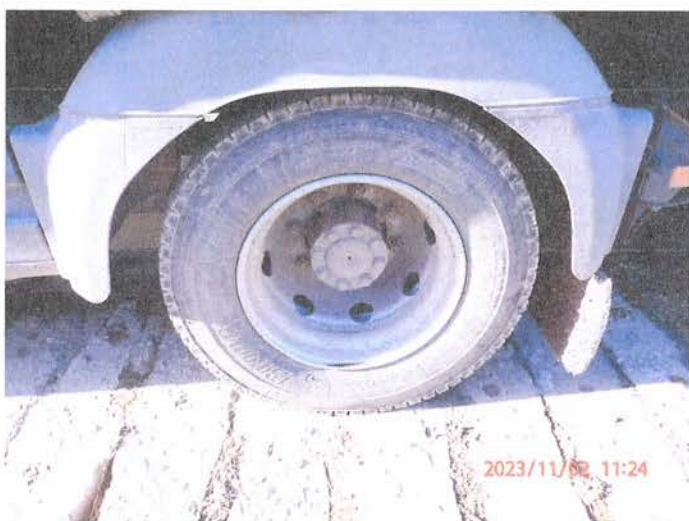
Fot. 7 PB020096